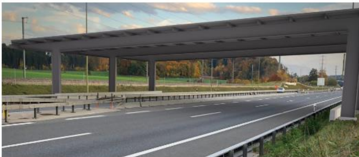
Die Autobahn als Solar-Kraftwerk / A4-KW – Projektvisualisierung

Mit solch einem Kraftwerk über der Hauptverkehrsachse durchs "Säuliamt" käme die Energieregion ihrem Ziel, der möglichst kompletten lokalen Energieproduktion bis 2050, einen grossen Schritt näher. Bereits jetzt glänzt die Energieregion Knonauer Amt mit einer Verdoppelung des solaren Deckungsgrads seit 2010.